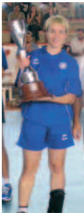
La temporada passada van guanyar la Lliga dels Pirineus. L'Estel va rebre la copa com a capitana de l'equip.