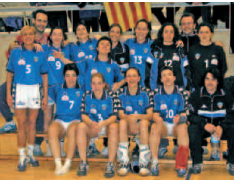
L'Associació Lleidatana d'Handbol celebrant la classificació per jugar la Copa de la Reina. L'Estel és la que porta el número 10.