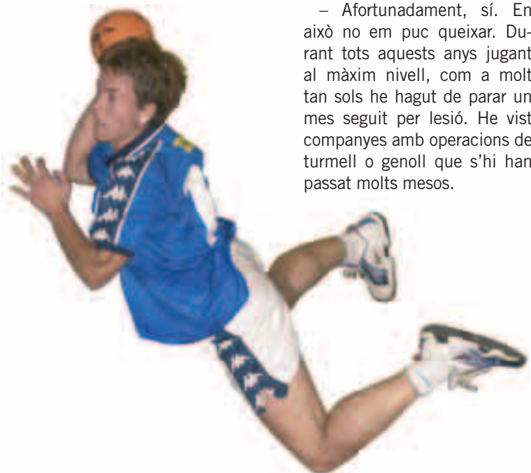
L'Estel efectuant un espectacular tir a porta, amb l'equip de l'Associació Lleidatana d'Handbol amb qui ha jugat durant setze anys.