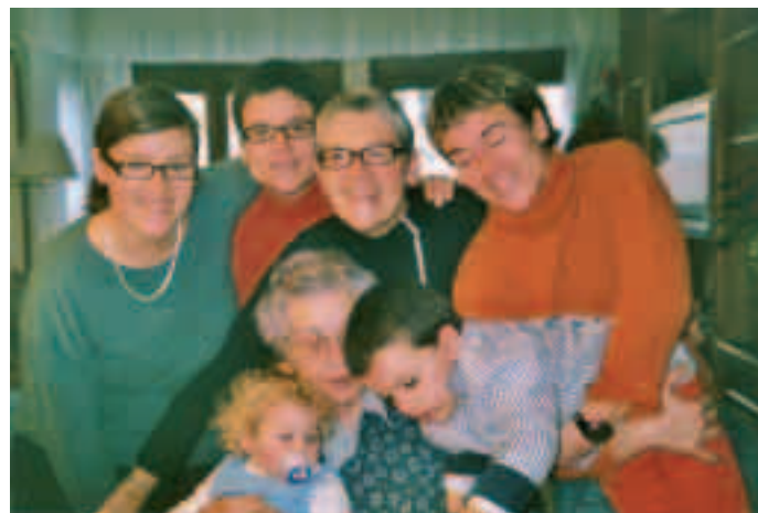
Una foto familiar amb la seva mare, àvia, germanes i nebots.

I ara, en el moment de la retirada, és quan em sento més valorada. La Paeria de Lleida em va fer una recepció. Ara, el dia 10 d'aquest mes de novembre, la Federació Catalana d'Handbol em lliurarà la "Insígnia d'argent" per la meua trajectòria esportiva. També notes el caliu d'alguns mit-