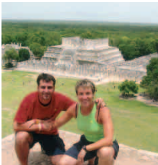
Durant un viatge a Mèxic amb la seva parella.

i que és una decisió difícil de prendre.